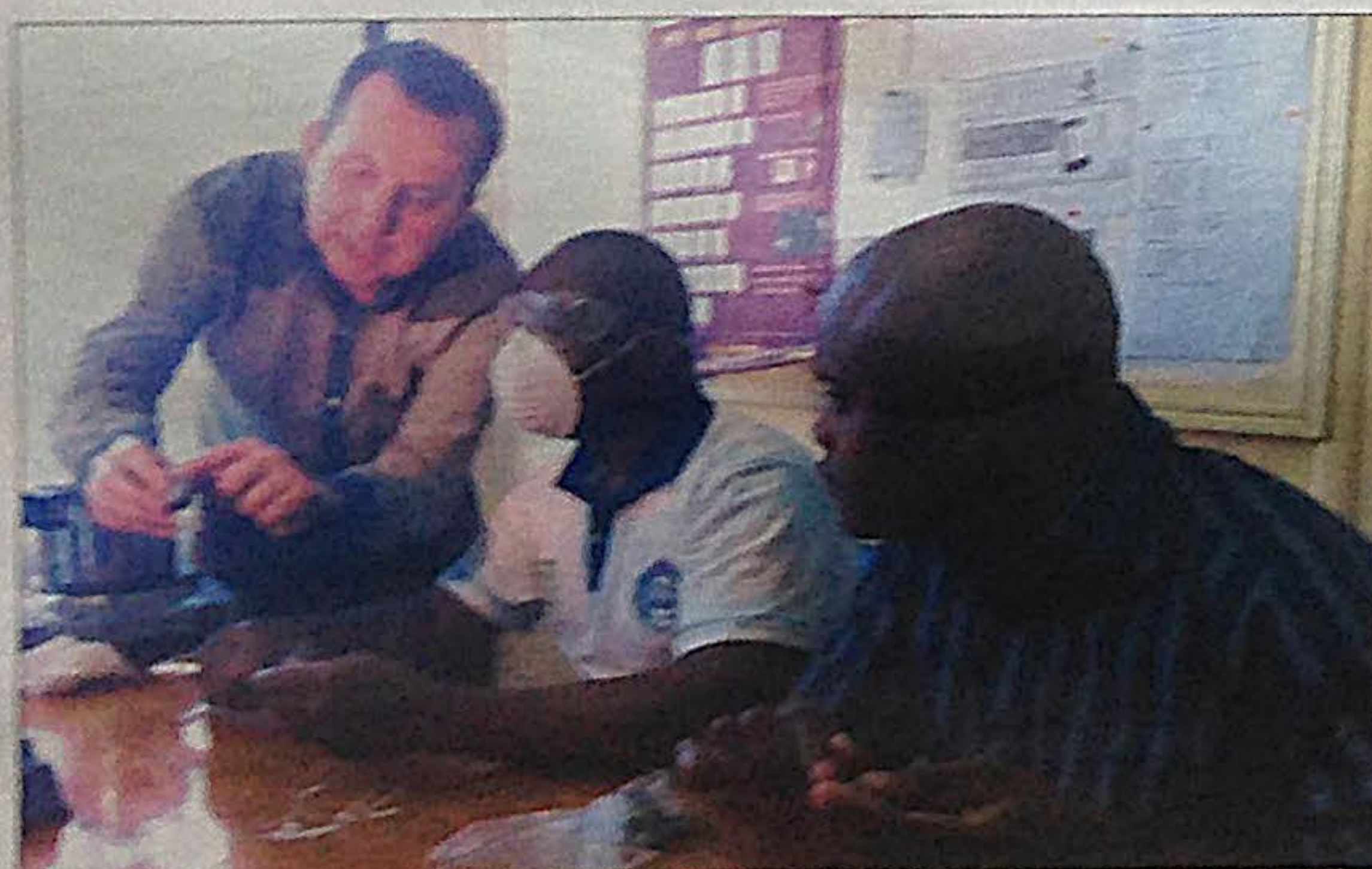
De 6-jarige jong uit Zutphen, namens het bedrijf Better Hears, geeft in Nairobi les van de Kenya Society for Deaf Children, hoe ze een oorstuk op maat kunnen maken voor een klant.