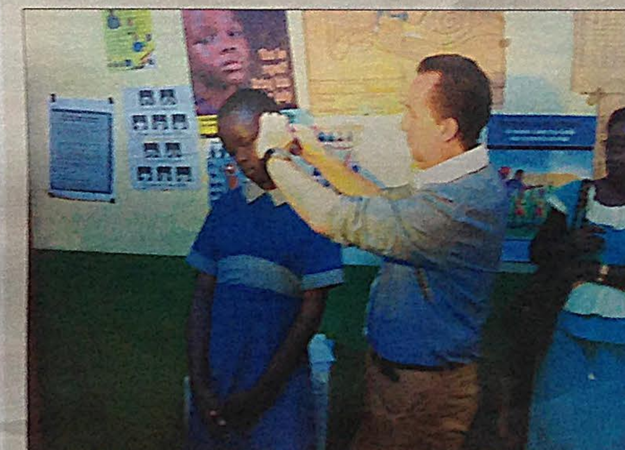
De 6-jarige jong van Better Hears plaatst een oorstukje met hoortoestel in het oor van een bijna doof meisje, in de Keniaanse plaats Mumias.