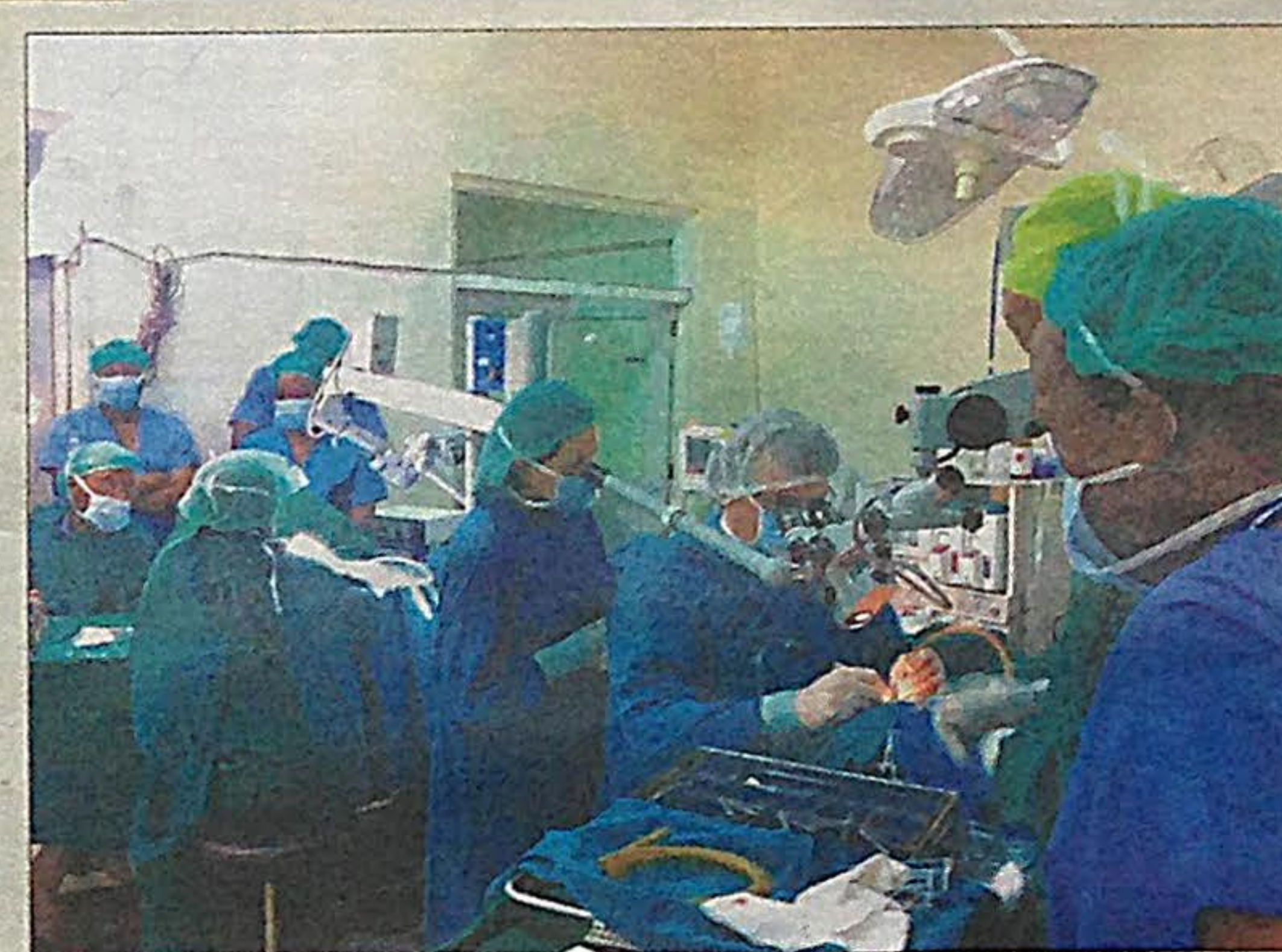
Als het team Nederlandse artsen in Nairobi is wordt op twee tafels tegelijk geopereerd. De operatiekamer wordt 'theatre' genoemd.